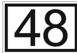
Figur 11-6 Vanlig adressenummerskilt.

Adressenummerskiltet viser til den enkelte atkomst. Skiltet må plasseres tydelig. Dersom adresseobjektet ligger et stykke fra vegen må det settes opp skilt ved vegen. En bør ha egne skilt på huset i tillegg. Er det flere adresseobjekt må en ha flere skilt ved vegen og på huset. En må unngå å sette opp skilt på porter og lignende som ikke er synlige når de er åpne.